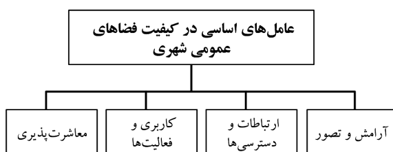
شکل (۱). عوامل اساسی در کیفیت فضاهای عمومی شهری (www.pps.org 2015)

طبق pps 1 مکان‌هایی برای مردم مهم تلقی می‌شوند که دارای چهار کیفیت اصلی می‌باشد که در شکل (۱) به آن اشاره شده است.