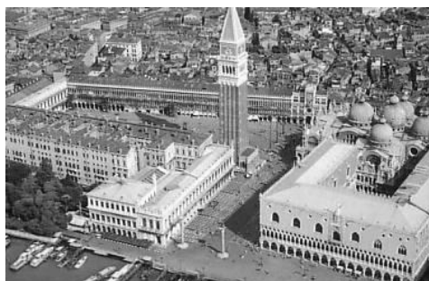
شکل (۵). عناصر فرهنگ و مذهبی و حکومتی در پیرامون میدانها