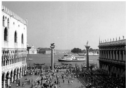
شکل (۴). انتهای محور طولانی میدان دریا

(در ضلع غربی) و سردر قیصریه (در ضلع شمالی) ساخته شده است (شکل (۳)). اطراف میدان را چهار بازار بزرگ احاطه کرده‌اند. هم‌زیستی ابنیه تجاری با ساختمان‌های حکومتی و مذهبی و همچنین وجود قدیمی‌ترین دروازه بازی چوگان جهان در میانه میدان از جاذبه‌های معماری میدان است. پیرامون میدان دویست حجره دو طبقه قرار دارد که از گذشته‌های دور به فروش صنایع دستی اشتغال دارند (www.ichto.ir1394).