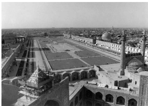
شکل (۳). انتهای محور طولانی میدان عناصر مذهبی

با بررسی‌هایی که در این مقاله انجام شد، وضعیت مؤلفه‌های تأثیرگذار در میدان نقش جهان و میدان سن مارکو در جدول (۴) آورده شده است که وجود علامت ++ به معنای برتری نسبی هر یک از میدان‌ها بر دیگری است و علامت -- به معنای وضعیت نامناسب‌تر مؤلفه‌ها در یک میدان نسبت به دیگری است.